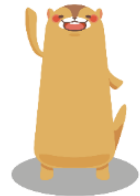
「aruku&公式キャラクター：ぼたろう」